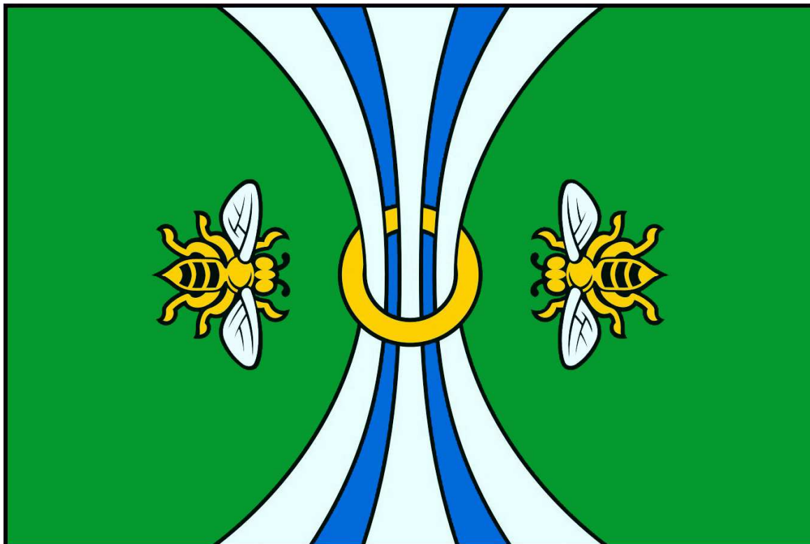
ФЛАГ Сампурского района Тамбовской области (цветное изображение)