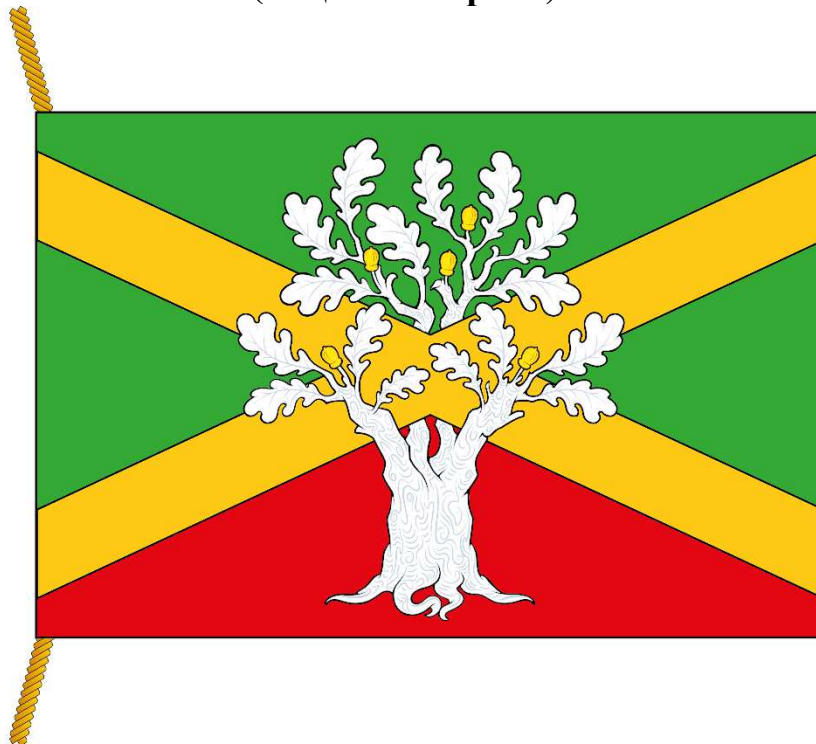
РИСУНОК ФЛАГА МУНИЦИПАЛЬНОГО ОКРУГА ХОВРИНО В ГОРОДЕ МОСКВЕ (лицевая сторона)

Приложение к Положению «О флаге муниципального округа Ховрино в городе Москве»