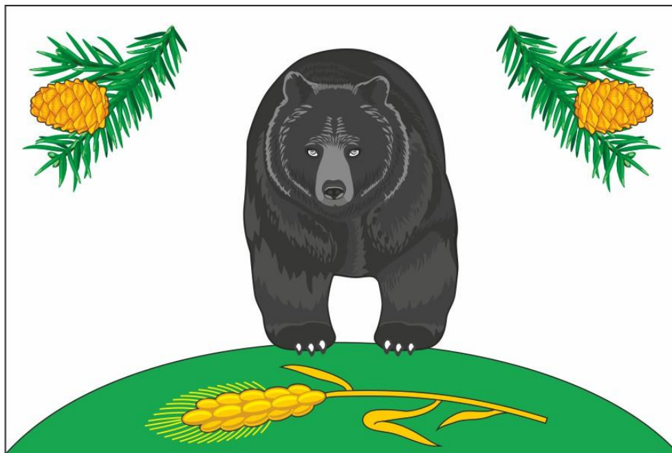
Флаг Новокривошеинского сельского поселения (цветное изображение)