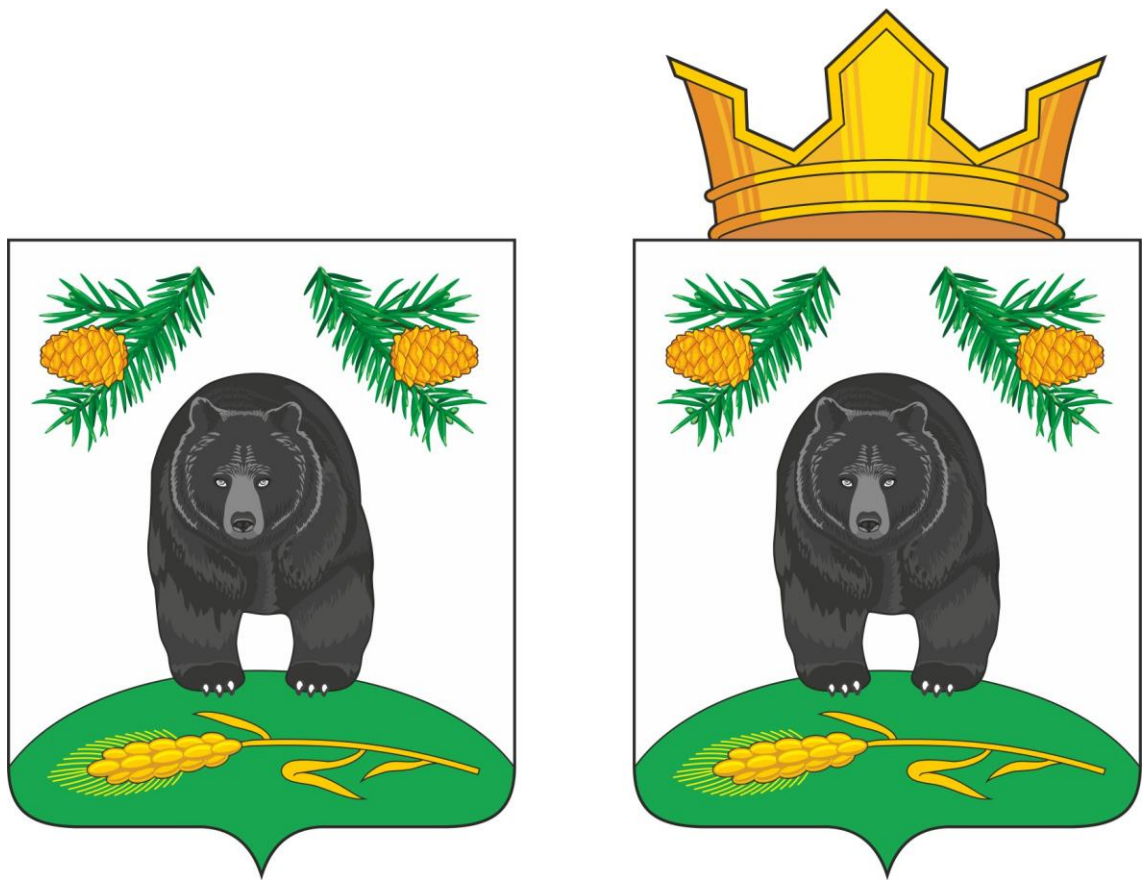
Герб Новокривошеинского сельского поселения (примеры воспроизведения в цвете)