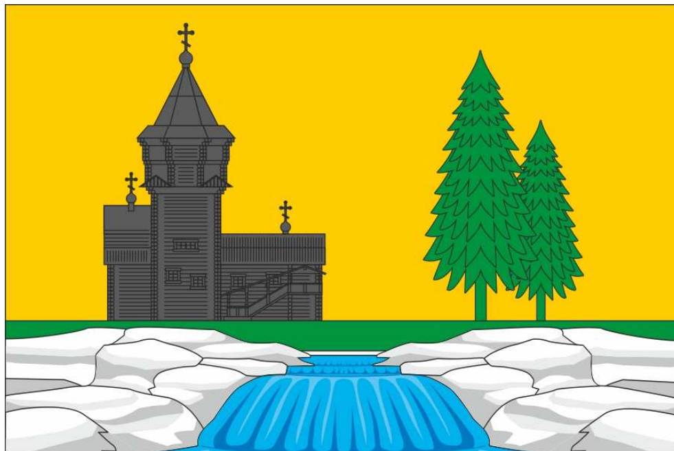
Флаг Кондопожского муниципального района (цветное изображение)