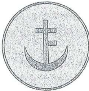
Рис. 2 Символ міста Старий Самбір (з печатки XIX ст.)