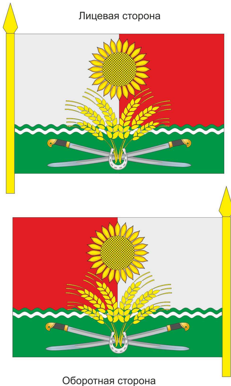
РИСУНОК ФЛАГА МУНИЦИПАЛЬНОГО ОБРАЗОВАНИЯ «РОДИОНОВО-НЕСВЕТАЙСКИЙ РАЙОН»

Председатель Собрания депутатов – глава Родионово-Несветайского района