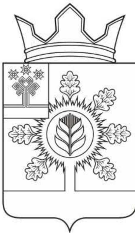
Герб Юманайского сельского поселения Шумерлинского района Чувашской Республики (примеры контурного воспроизведения в чёрном и белом цветах)