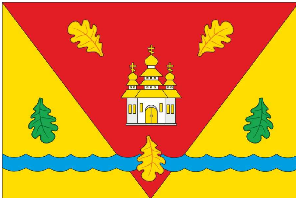
Флаг Туванского сельского поселения Шумерлинского района Чувашской Республики (цветное изображение)