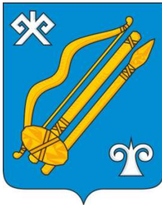
Герб муниципального образования «Город Горно-Алтайск» (воспроизведение в цвете)