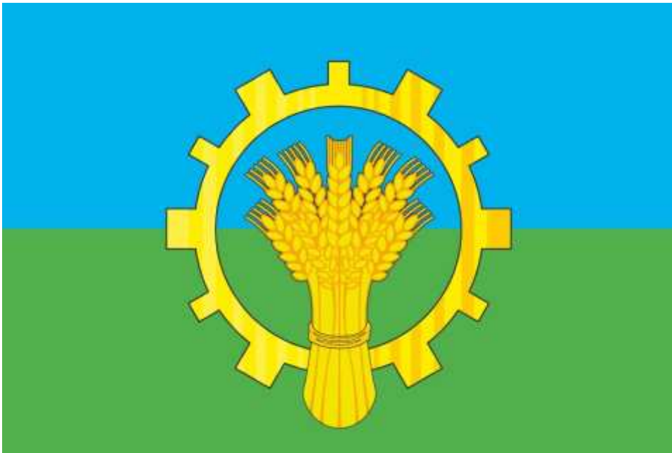
Флаг Таврического городского поселения (цветное изображение)