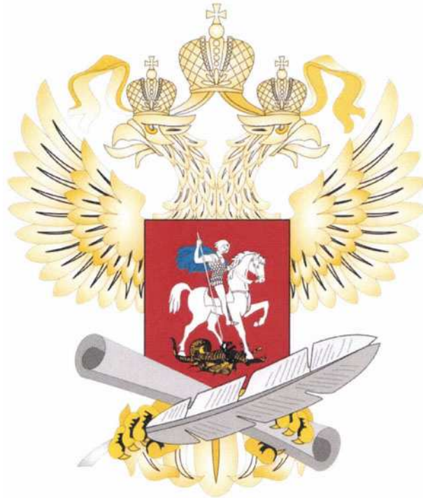
Рисунок геральдического знака - малой эмблемы Министерства просвещения Российской Федерации