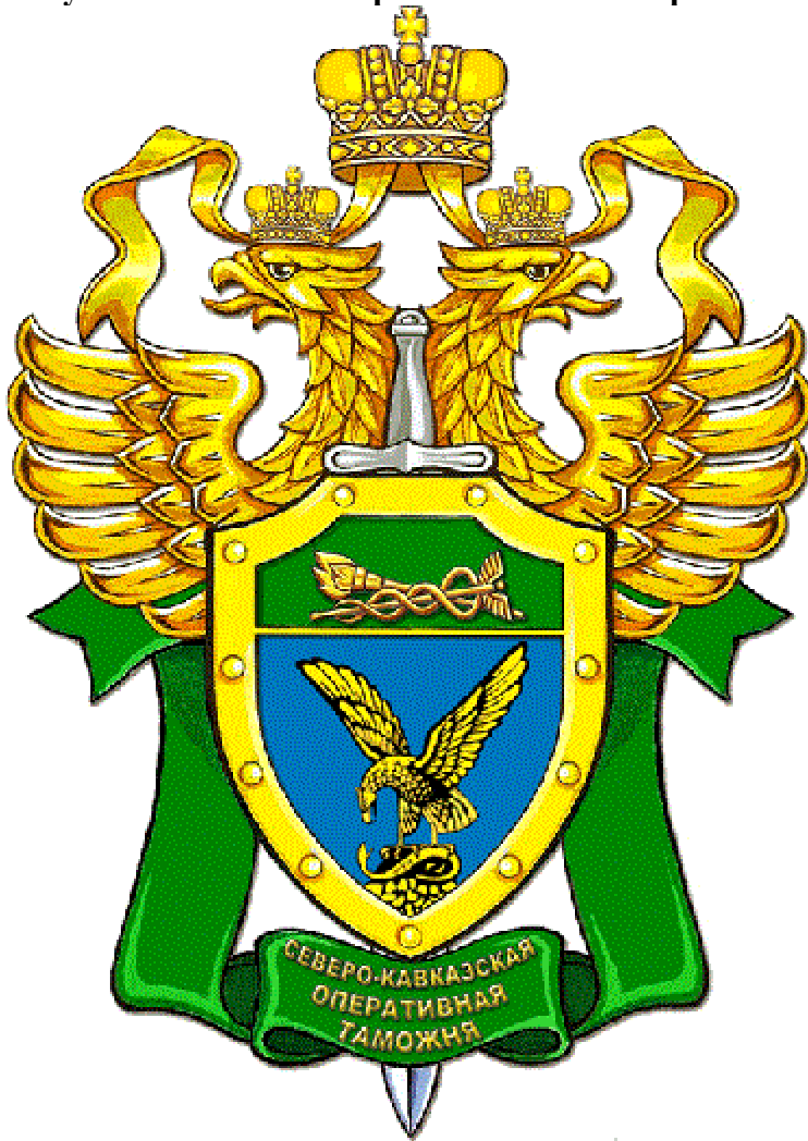
Рисунок эмблемы Северо-Кавказской оперативной таможни и её описание

Эмблема представляет собой конусообразный геральдический щит с фигурными вырезами в верхней части, окаймлённый золотой каймой с таковыми же шляпками обивочных гвоздей и повышенно пересечённый тонкой золотистой нитью.